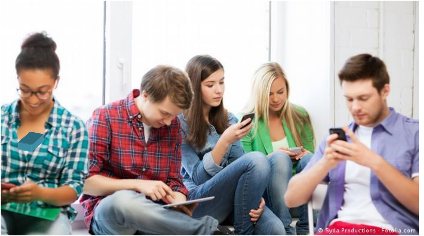
الشكل الثالث صورة تمثل اتصال الكتروني لدي طلبة الجامعيين