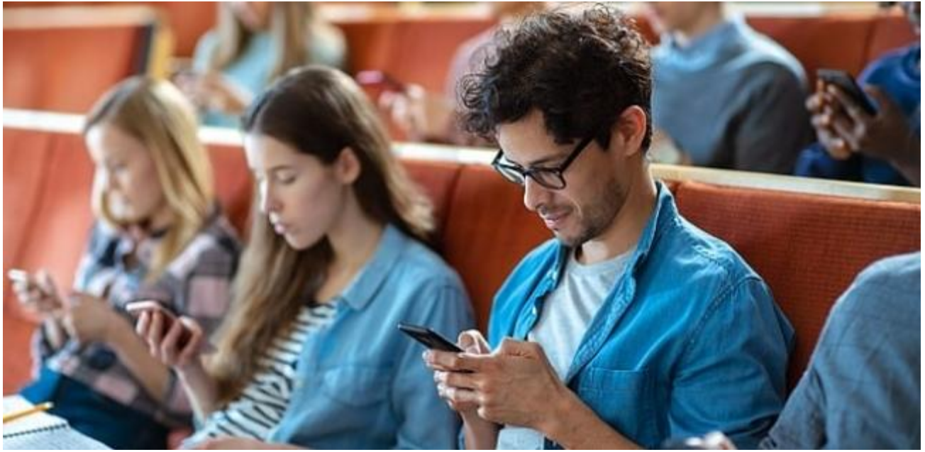
الشكل الرابع صورة ممثلة للطلبة اثناء اتصال الالكتروني فيما بينهم