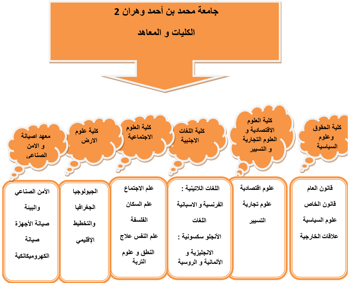
الشكل 1 : مخطط توضيحي لكليات جامعة محمد بن أحمد وهران 2 و تخصصاتها