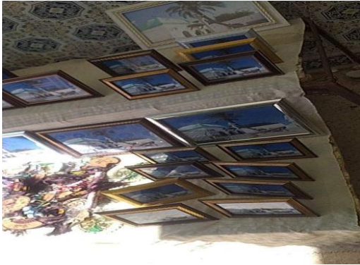
صور ضريح سيدي لخضر بن خلوف المعروضة للبيع