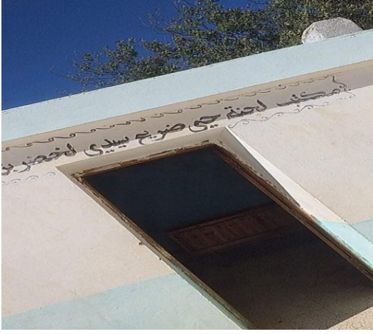
مكتبة الضريح سيدي لخضر بن خلوف