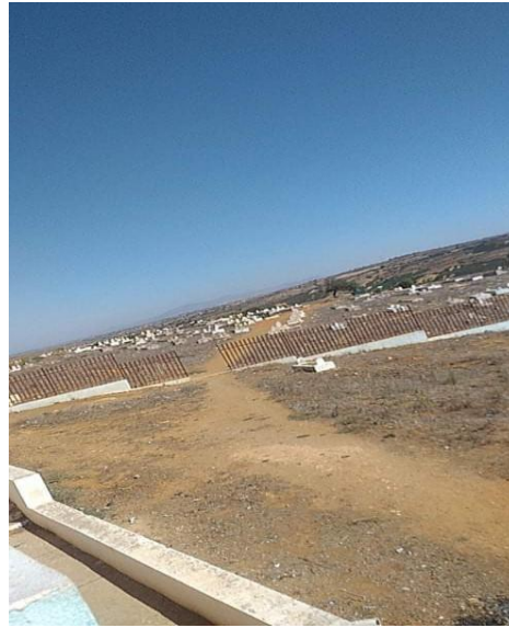
المقبرة المحاطة بضريح سيدي لخضر بن خلوف