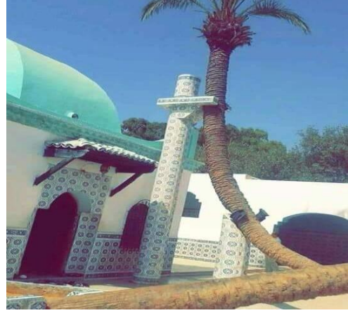
النخلة المحاطة بضريح سيدي لخضر بن خلوف