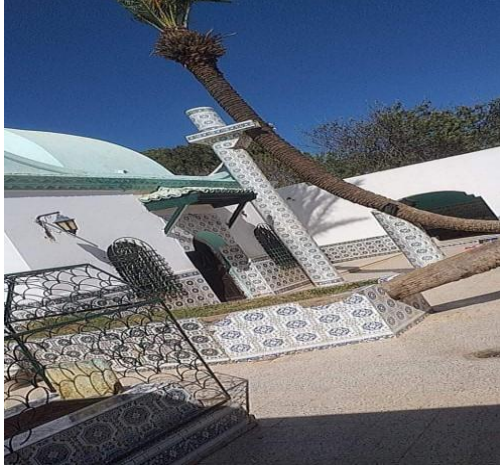
المدخل لضريح سيدي لخضر بن خلوف