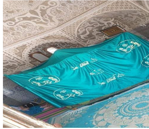
ضريح سيدي لخضر بن خلوف