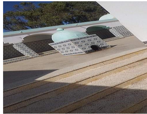
مكان تجمع الزائرين