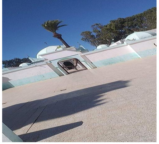
المدخل الرئيسي لضريح سيدي لخضر بن خلوف