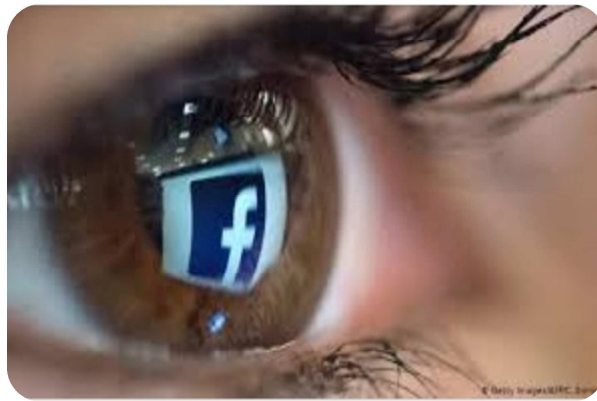
الصورة رقم 03: إفراط في استخدام الفيسبوك