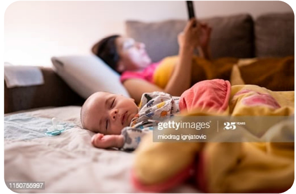
الصورة رقم 01: إهمال الأطفال نتيجة تعلق بالفيسبوك