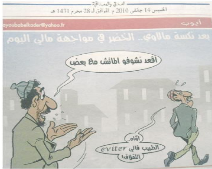
الصورة رقم (21) الصادرة بتاريخ 14 جانفي 2010.

فمن منطلق اتصالياتنا بالمبحوثين، اتضح أن الصورة تحمل خطابين، الأول رياضي يتعلق بانخراط الجزائر أمام ملاوي وهو الحدث الذي شد إليه اهتمام الشعب، فيما يجمع الثاني بين ما هو رياضي وسياسي، وبين الوجهتين كان كل طرف يقدم قراءته استنادا إلى ما يعكسه الرسم وكلاهما على درجة بالغة من الأهمية لتوفر عامل الإقناع الذي كان حاضرا في كلا الرأيين، لكن الوجهة الأكثر تحيلا هي التي تحدثت حول الخطاب السياسي، فقد كانت أكثر عمقا ولم تكتف بما هو واضح ومطروح، بل قامت بتفكيك الرسم لقراءة ما وراء خطوطه وهنا اتضح أنه سياسي يضع الرياضة في الواجهة ليتمكن من المرور.