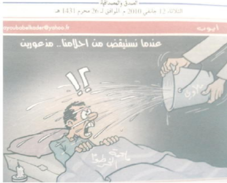
الصورة رقم (20) الصادرة بتاريخ 12 جانفي 2010.

تزامنت الصورة ولقاء الفريق الجزائري بنظيره المالاي في كأس أمم إفريقيا وانخراطه بثلاثة أهداف مقابل لا شيء، ما أثار حفيظة الشعب الجزائري الذي تعوّد على تحقيق نتائج إيجابية ولم يتمكن من استيعاب النتيجة، بحكم أن الفريق الخصم في نظرياً كأضعف منتخب في المجموعة التي تتواجد فيها الجزائر، لتعدد الشحيلات هنا ويحتمل الكثير من المدرب الوطني مسؤولية الإخفاق بعد سلسلة من الانتصارات كانت آخرها تلك المسجلة بالسودان والفوز على مصر والظفر بتأشيرة كأس العالم.