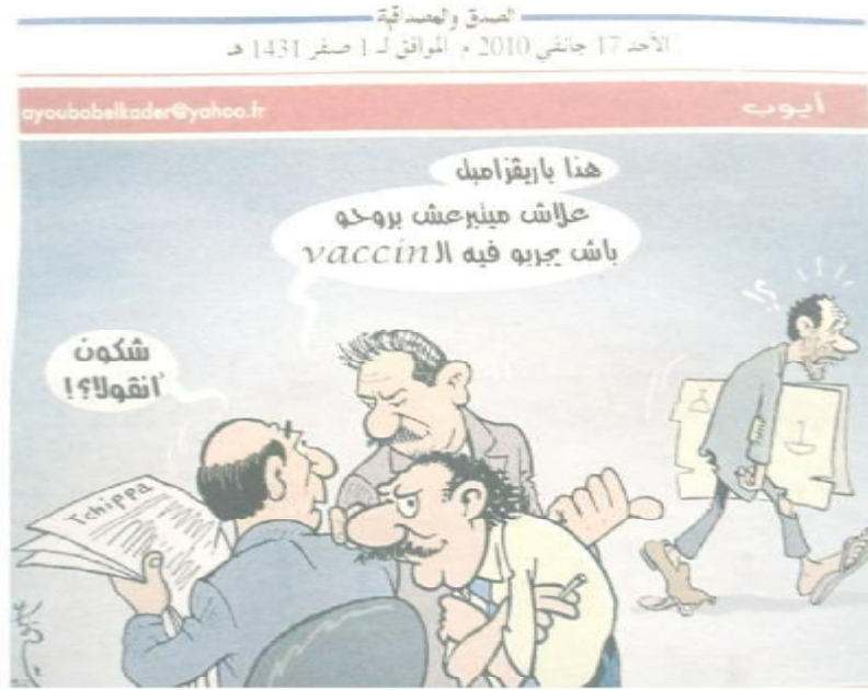
الصورة رقم (24) الصادرة بتاريخ 17 جانفي 2010.