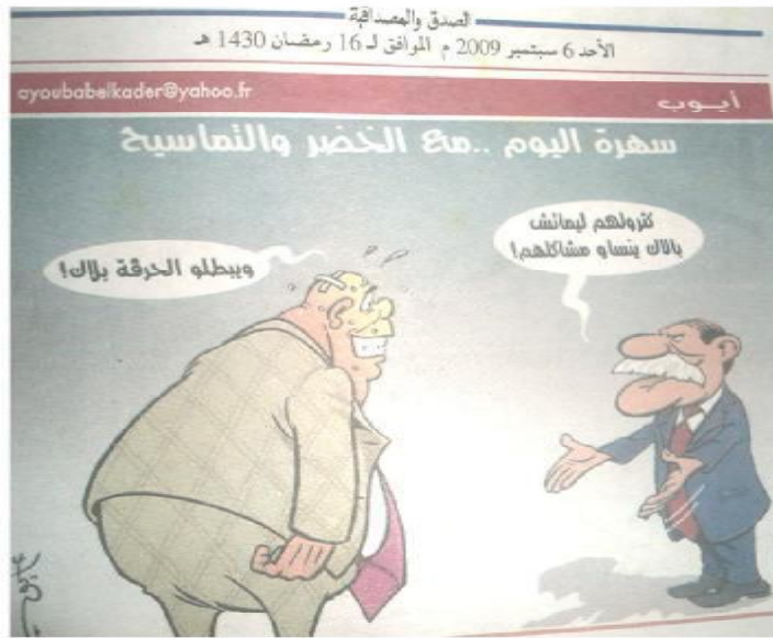
الصورة رقم (03) الصادرة بتاريخ 06 سبتمبر 2009.

يندو الجانب السياسي حاضرا وبقوة في هذه الصورة، التي سعى "أيوب" من خلالها إلى إقحام الرئيس بوتفليقة كطرف فاعل فيما هو كروي، فهي الشخصية التي تفنن "أيوب" في رسمها منذ العهدة الرئاسية الأولى له، لكن المثير للانتباه هنا، هو سبب إقحام رئيس الدولة في موضوع كهذا، ولتشريح هذه النقطة كان لنا حديث مع