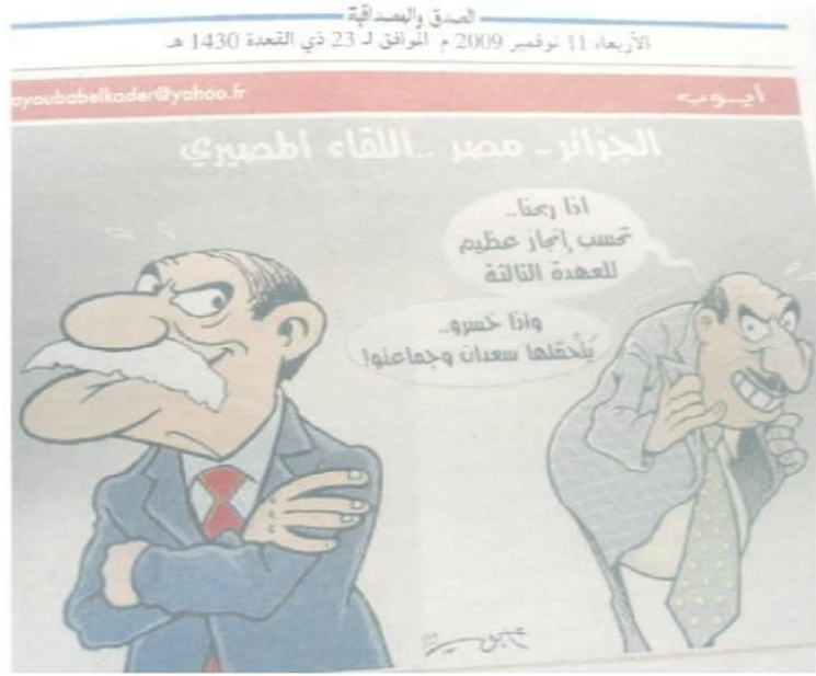
الصورة رقم (07) الصادرة بتاريخ 11 نوفمبر 2009.

الظاهر أن هذه الصورة جاءت لتكملة الطرح السابق وإثراءه، فلقاء مصر والجزائر أخذ أبعادا أخرى ليتحوّل من حدث رياضي إلى رهان سياسي يخدم الرئيس ومن معه، فاللقاء تم تحويره وخرج عن سياقه العام ليصبح شبيها بمشروع تنموي استغله الرئيس ليكسب تأييد الشعب ويظهر في الواجهة بمظهر إيجابي مهمّ له مصلحة البلاد والعباد، وليضمن مسارا جيدا لعهدته الثالثة التي تولاها شهر أبريل 2009، فهو الذي أعطى اهتماما بالغا للرياضة ودعمها يقينا منه بمدى ترسخها وسط الشعب، ليشتغل حول ذلك ويمنحه الكثير من الوقت