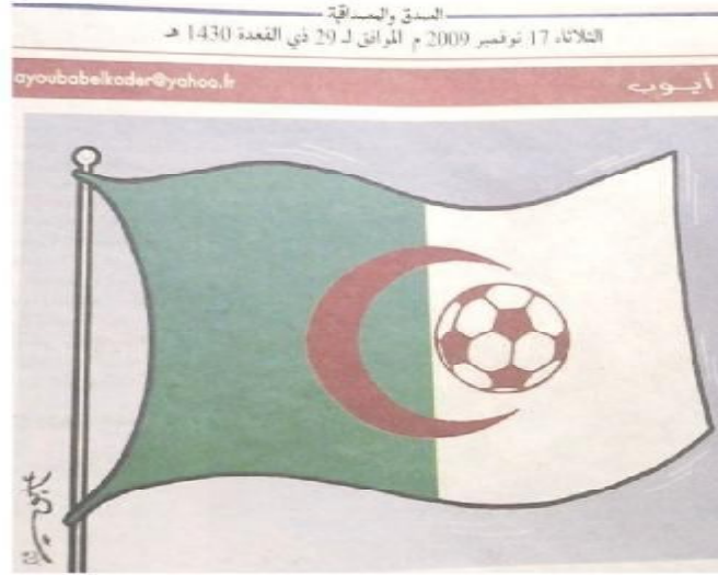
الصورة رقم (13) الصادرة بتاريخ 17 نوفمبر 2009.