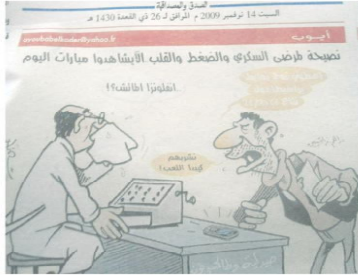
الصورة رقم (10) الصادرة بتاريخ 14 نوفمبر 2009.

تم إنتاج هذا الرسم ولقاء الحسم بين الجزائر ومصر من حيث أنه مؤهل لكأس العالم، فالفريق الجزائري كان أمام ثلاثة خيارات، فالأولى هي الفوز أو التعادل وإما الخسارة بفارق هدف واحد، فيما كان الفراغنة مطالبون بتحقيق نتيجة إيجابية تترجمها لغة الأرقام بفارق ثلاثة أهداف كاملة حتى يحصلوا على تأشيرة الموندياال، أو على الأقل الفوز بفارق هدفين لتكون لهم فرصة إجراء مباراة فاصلة في دولة أخرى والتي من خلالها يتأكد التأهل والمرور إلى واحد من المواعيد الرياضية المهمة التي تعتبر حلم الكثير من شعوب العالم.