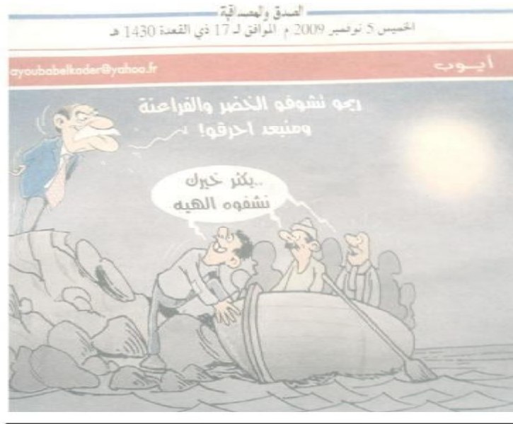
الصورة رقم (06) الصادرة بتاريخ 05 نوفمبر 2009.

فالحطاب هنا مشفر، لكن يمكن قراءته وهو انتشار متناقضات كثيرة في المجتمع، غيبت الشباب لأسباب معينة، ما جعل هذه الشريحة تفكّر في بدائل، وهي التي يمكن أن تؤجل كل شيء حال تعلق الأمر بحب الوطن وما له علاقة بذلك، فالشباب قد يفكّر في أمور كثيرة لإحداث التغيير لكن بمجرد الحديث عن البلاد تجده في الأمام متناسيا كل مشاكله وهمومه، وكل برهجة أو فكرة لا يمكن أن تحل محل الوطن ولو في معطيات صغيرة مثلما هو حال كرة القدم.