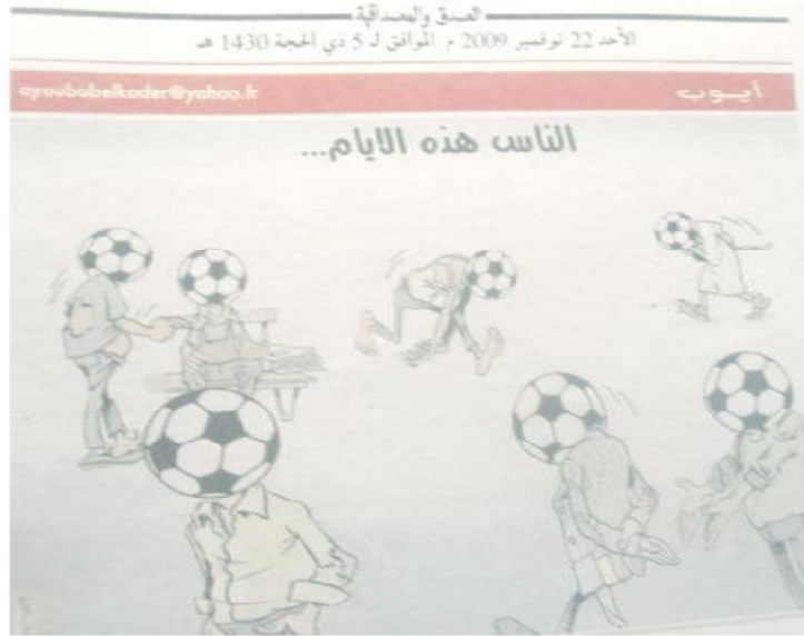
الصورة رقم (17) الصادرة بتاريخ 22 نوفمبر 2009.