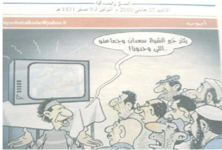
الصورة رقم (27) الصادرة بتاريخ 25 جانفي 2010.

تزامن إنتاج الرسم وفوز الجزائر على كوت ديفوار بنتيجة ثلاثة أهداف مقابل هدفين، ما سمح للفريق الأول بالتأهل لنصف نهائي كأس أمم إفريقيا وسط فرحة عارمة اختزلت مظاهر القلق والاضطراب التي عاشتها الجماهير الجزائرية قبيل لعب المباراة، فالجميع كان على الأعصاب ومتخوف من المنتخب الإفريقي المعروف بقوته وضغطه ولاعبيه المحترفين، لتأتي النتيجة إيجابية وتنسف التكهانات السابقة التي رجحت كفة الفوز لمنتخب كوت ديفوار.