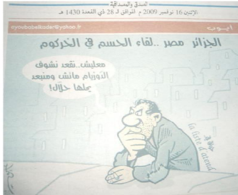
الصورة رقم (12) الصادرة بتاريخ 16 نوفمبر 2009.

جاءت الصورة تحت عنوان (الجزائر مصر.. لقاء الحسم في الخرطوم) تزامنا والمباراة الفاصلة المؤهلة لكأس العالم بالخرطوم السودانية وهو ما شد إليه اهتمام الجماهير الجزائرية التي بقيت على الأعصاب تنتظر اللقاء والنتيجة، وهذه المرة حاول "أيوب" الوقوف على الحدث بطريقة الخاصة من خلال استحضاره دوما البعد السوسيوولوجي، المدرج بطريقة ساحرة فكاهية تحمل خطابا، وهو ما حاولنا الوقوف عليه من خلال اتصالنا بالمبحوثين، وضمن السياق ذاته أشارت إحدى المبحوثات وهي (خياطة) إلى أهمية الصورة قائلة: فيها معنى كبير، العنوان déjà راه يقول الجزائر مصر.. لقاء الحسم في الخرطوم، باش يقول الخرطوم قال الخرطوم على خاطرش بزاف ناس ما يعرفوش ينطقوها بقولو الخرطوم، على خاطرش ما يعرفوهاش وبلاك خطرتهم لولا يسمعو بيها، الناس تقريبا يعرفو غي السودان بصح هادي الخرطوم قليل لي يعرفها من قبل غي ليقاري ولا الناس لي يعرفو، بصح لخرين كي عرفو بلي غادي يلعبو فيها الماتش عاد ولاو يقولوها وما يقولوهاش نيشان يقولولها (الخرطوم) وأكثرتهم الناس الكبار، زيد كاين في التصويرة واحد مواطن راه مجمع ويخمم وفي يده سيجارة ويقول (معليش.. نقعد نشوف اللوزيام مانش ومنبعد يحلها حلال) هنا راه فضّل الكرة على خدمته لي سايب كره من التخمام فيها وشاف بلي البولة خير ومن بعد