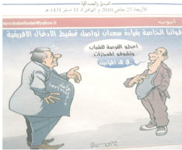
الصورة رقم (29) الصادرة بتاريخ 27 جانفي 2010.

جاء الرسم تحت عنوان: (قواتنا الخاصة بقيادة سعدان نواصل تمشيط الأدغال الإفريقية) وهو ما يثير الكثير من التساؤل ويجعلنا أمام فرضيتين أساسيتين هما: إما أن يكون العنوان جاء في شكل تشبيه للإشادة بما حققه الفريق الجزائري من نتائج عقب فوزه على فريق كوت ديفوار وكانت مهمته دفاعية مماثلة لدفاع العسكر عن إقليم ما أو قضية معينة: وإما أنه جاء ليقول أن الرياضة تسير بأوامر من السلطة السياسية، فهي من يتحكم فيها ويرسم لها طريقها، خاصة إذا ما علمنا أن القوات الخاصة هي مجموعة تابعة للعسكر أو الجيش، وهو ما سنحاول الوقوف عنده استنادا إلى ما تعكسه قراءات المبحوثين للموضوع.