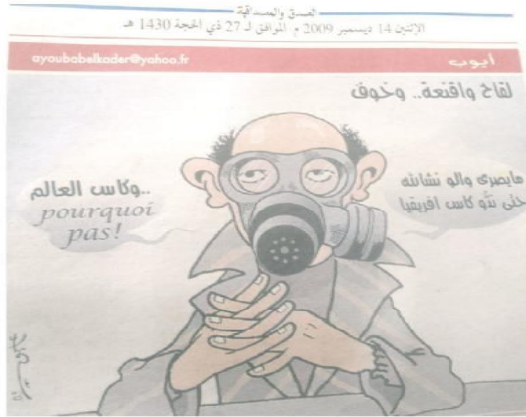
الصورة رقم (19) الصادرة بتاريخ 14 ديسمبر 2009.

تتصل الصورة هنا بموضوعين مهمين، الأول منهما له علاقة بأنفلونزا الخنازير والثاني يرتبط بالرياضة الحاضرة دوماً، بحكم أن الفريق الجزائري كان يحضر خوض غمار كأس إفريقيا للأمم وكذا كأس العالم، وهو ما أثار اهتمام المواطن، فالأنفلونزا أثارت حالة رعب كبير وسط المواطنين المتخوفين من انتشارها بعد حديث الجهات الوصية في البلاد عن إنفاق ما مجموعه 1200 مليار سنتيم لمواجهة الخطر، وكان قد تقرر انطلاق التلقيح يوم 19 ديسمبر 2009 وهو ما لم يتمكن المواطن من معرفة تفاصيله ولا الطريقة التي يتم بها وما هي أعراض المرض لعدم وجود حملات تحسيسية كافية للتعريف به، ومنهم من لم يهضم الفكرة أصلاً، ليقى حديث الشعب رغم الكلام عن الداء الكرة وتفصيلها وكيف ستكون مجريات الحدثين الإفريقي والعالمي، فإلّاكل انصرف حول ذلك لاهتمامه به، فيما بقي التلقيح مجرد إعلان لم يقتنع الكثيرون بمعطياته مثلما طالعنا به الميدان ونحن نطرح الموضوع، متسائلين عن سبب تضخيم ذلك رغم أن القائمين على إدارة المستشفيات المقصودة من طرف الكثيرين لم يكلفوا أنفسهم حتى عناء شرح الداء، وما الهدف من التلقيح، وهو ما جعل المواطن يستفسر عن جدوى صرف مبالغ مالية ضخمة والفكرة مبهوتة، مؤكداً ضرورة التكفل بمشاكل المواطن وحلّها قبل الحديث عن أمور تبدو بعيدة.