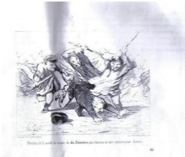
صورة توضح أعضاء جمعية 10 ديسمبر وهي تؤدي مهامها الخيرية

أدى إلى الحكم بالسجن على "شارل فيليبون" مدير صحيفة (الشاريفاري). 41 ومن الصور التي لاقت إقبالا جماهيريا كبيرا، ذاك الرسم الذي نشره "دوميه" بمجلة (الشاريفاري) بتاريخ الفاتح أكتوبر 1850 معنونا إياه بـ: أعضاء جمعية 10 ديسمبر تؤدي مهامها الخيرية... والذي حاول من خلاله أن يقول أنه ومنذ انتخاب الرئيس "لويس نابليون بونابارت" في 10 ديسمبر 1848 أصبحت الدعاية النابوليونية تمهد الطريق لاستعادة الإمبراطورية بشكل أكثر علنية وبضراوة، وظهرت قوة المجلس أو الجمعية المذكورة سلفا بالتخلص من المعارضين وبصفة فورية، 42 ولأن الكاريكاتور يشكل تهديدا حقيقيا عليها (الجمعية ومن يدعمها) وعلى مصالحها مجرد كشفه عن ألامعيبها ومخططاتها، خاصة مع الأعداد الكبيرة من متبعي هذا الرسم في الساحات العمومية، تم التضييق عليه وهو ما تظهره الصورة من خلال ممارسات هذه الجمعية في حق الرسامين والفنانين الذين سعت إلى تغييبهم، فالضرب واضح وفي ذلك دلالة صريحة على التضييق الذي تعرض إليه من اتخذوا على عاتقهم مسؤولية نقل انشغالات وهموم الشعب، وهي سياسة كان الهدف من وراءها التستر عن جملة من الخروق التي عمل الكاريكاتور على إظهارها وكشف المتورطين فيها، مع ملاحظة كل من له يد في ذلك، لجعل المواطن في الصورة ولنكون له فرصة المطالبة بالقصاص، كما كان هذا هو حال أو مصير كل شخص يحاول المعارضة أو الظهور بموقف يخالف سياسة البلاد.