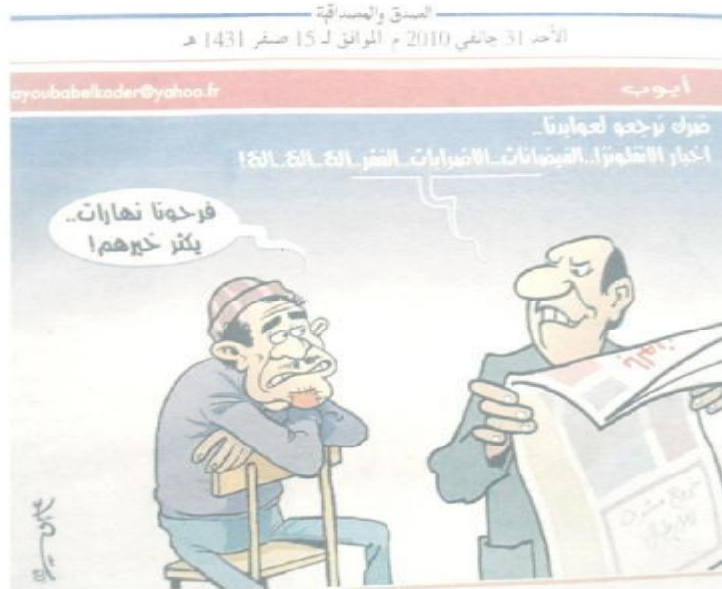
الصورة رقم (32) الصادرة بتاريخ 31 جانفي 2010.

جاءت الصورة تحت عنوان (ضرك نرجعو لعوايدنا.. أخبار الأنفلونزا.. الفيضانات.. الإضرابات.. الفقر.. إلخ.. إلخ.. إلخ) وهو رسم كاريكاتوري يكاد يجمع ما كان قد مر بنا من مواضيع والتي تحدثت في مجملها عن وضع اجتماعي صعب تداخلت فيه السياسة إلى حد كبير بحسب ما ترجمته قراءة المبحوثين لكل واحدة منها، ليبين أن الكرة كانت قد ملأت ثغرة المشاكل إلى حد ما، وبمجرد نفايتها عادت من جديد، فبعد أن كان المواطن البسيط مرتبطا بما كملأه للهروب من واقعه الصعب ها هي السليبات بما فيها من فقر وإضراب وفيضانات والقائمة طويلة تعود من جديد لتتغصص عليه فرحته وانشغاله بما لبعض الوقت وعاودت الرجوع أيضا لتنهك الحكومة وتضعها أمام الأمر الواقع، بعدما استفادت من الكرة وارتاحت من مشاكل المجتمع لمدة تبدو أنها قصيرة، لكنها في الحقيقة خدمتها وكانت سبيلها لإلهاء الشعب وجعله رهينا لها.