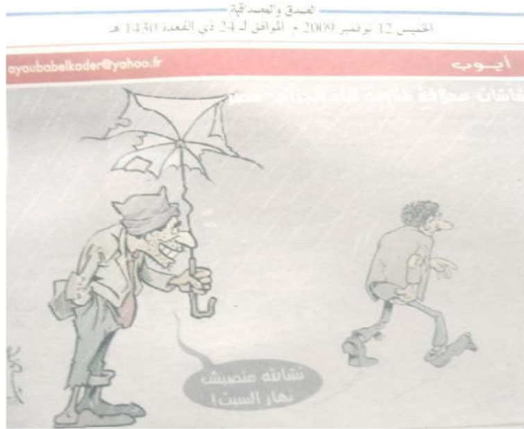
الصورة رقم (08) الصادرة بتاريخ 12 نوفمبر 2009.

حملت الصورة عنوان (شاشات عملاقة متابعة لقاء الجزائر-مصر) وهذا بعدما أعطى الرئيس أوامر بضرورة تنصيبها على مستوى الساحات العمومية ليتسنى للمواطن مشاهدة مباراة الجزائر ومصر التي شددت إليها اهتمام مناصري كلا الفريقين، كونها مؤهلة لكأس العالم، فهو لقاء الحسم والمصير، ما جعل كلا الطرفين يوظفان كل ما لديهما للظفر بتأشيرة الفوز وسط حملة إعلامية كبيرة صاحبت الموعد وبشكل خاص من الجانب المصري الذي سخر ترسانة من الأسماء لإضعاف عزيمة الفريق الجزائري والحط من معنوياته وتحسيس الشعب المصري أنها معركة تتعلق بالوطنية وبفرض الذات وهم الفراغنة المذكورين في التاريخ بأبجاذهم وإنجازاتهم الراسخة منذ أمد بعيد، وهي الحرب النفسية التي رفضت الجزائر إقحام نفسها فيها باستثناء بعض العناوين الصحفية الوطنية التي وقعت في شرك الإعلام المصري ودخلت معه في سلسلة من عمليات المد والجزر وهو ما كان يهدف إليه الإعلام المصري منذ البداية ويبدو أنه نجح فيه بعد أن جرّ إليه بعض الجرائد، التي لم تكذب تخرج من الصراع إلا بشق الأنفس، وعليه فالرسم الموجود بين أيدينا هو ما دفع بنا لتعريج حول كل ذلك، حتى نفهم المقصود من الرسالة.