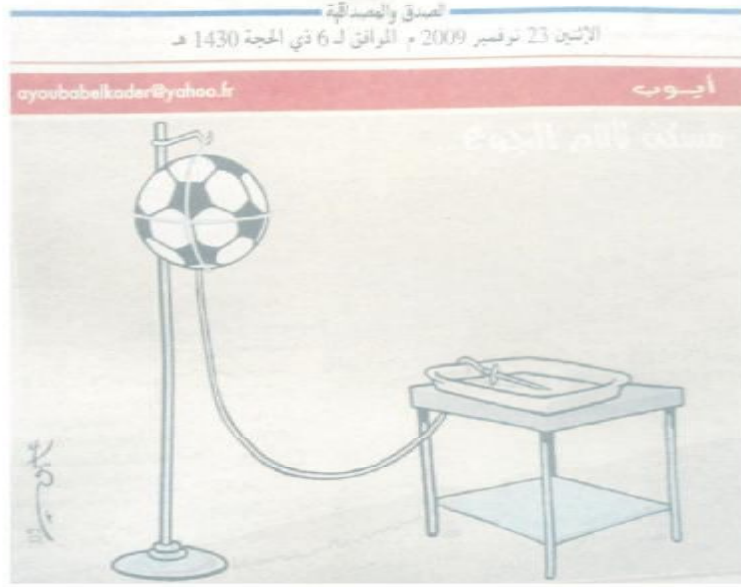
الصورة رقم (18) الصادرة بتاريخ 23 نوفمبر 2009.

ولهذا الموضوع علاقة بالصورة السابقة، وقد يكون تكميليًا بدليل ما وقفنا عنده ونحن نتحدث إلى المبحوثين، فالرسم حمل عنوان (مسكن لآلام الجوع...)، تظهر من خلاله كرة قدم في غرفة مخصصة لعلاج المرضى وخاصة منهم ضعاف الجسد اللذين يحتاجون إلى مقوي، فبدلاً من ظهور هذا الأخير باعتباره هو من يعلق بهذا الشكل نجد الكرة مكانه في محاولة للسخرية وأيضاً لتمرير خطاب مشفر، ولتشرح الفكرة أكثر والوقوف على ما تحمله من معطيات كان لنا حديث مع (سيدة مائدة في البيت)، مشيرة إلى: "العنوان هو (مسكن لآلام الجوع...) وكاين 3 نقاط الفاهم يفهم ويكمل الخطاب على حساب شراه فاهم، وهادي رسالة اجتماعية وسياسية كبيرة، وراه "أيوب" دار هنا une chambre كيما ليداوو فيها المرضى ونلقو فيها السيروم، بدل ما نشوفو السيروم لي يتعلق بهاد الشكل رانا نشوفو كرة معلقة والخيط محطوط في صينية، بمعنى الدولة هنا راهي تقول للشعب مكان والو للعيشة والمائلة ليغا ياكل البولة ياكل هادا ليكاين على خاطرش درايم كبار صرفوهم وخسروهم عليها والشعب مسكين راه قاعد يموت بالجوع، لا خدمة لا سكنى ولا حتى مشاريع تريحه وتوفرله شا يحتاج، أمالا هادا خطاب سياسي راه يقول بلي الدولة راهي تقول للشعب ما تزيدوش تهدرو على العيشة وشا خاصكم غي الكرة ودعمناها أيا كولو منها ويها وريحو وريحونا معاكم". 70