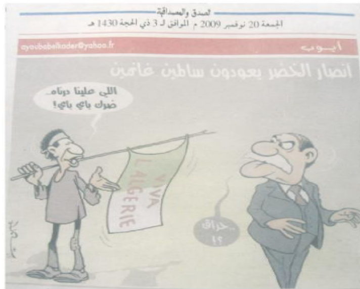
الصورة رقم (15) الصادرة بتاريخ 20 نوفمبر 2009.

1- نهاية تفاصيل توظيف الكرة سياسيا وحضورها كوجه للصراع: