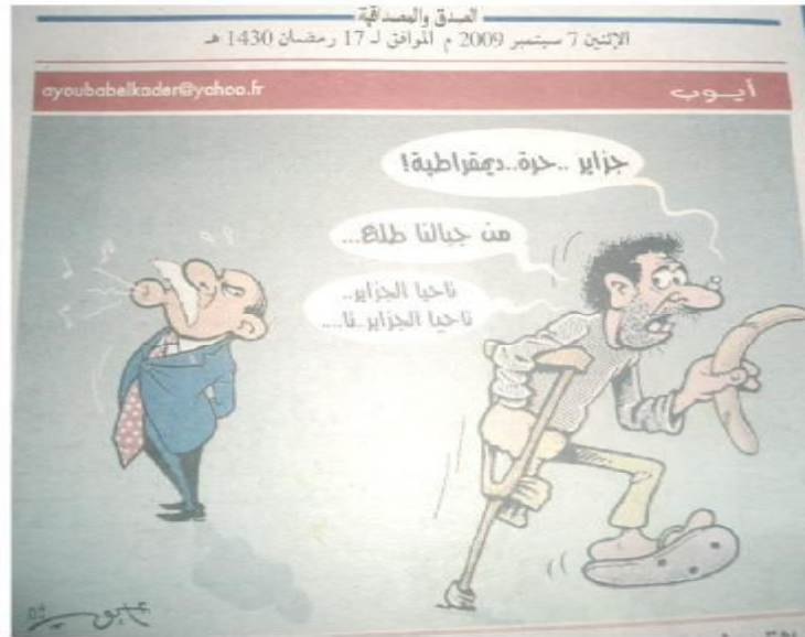
الصورة رقم (04) الصادرة بتاريخ 07 سبتمبر 2009.

فهو بهذا الكلام، حاول الوقوف عند كل المعطيات السوسيوولوجية المتعلقة بالوضع العام للمجتمع، الذي سئمت منه الجهات الوصية بعدما عجزت سياستها وبرامجها عن احتواء كم هائل من المشاكل المطروحة، لذلك اتجهت صوب الكرة كحل مؤقت يجعلها في منأى عن الלהجة المتصاعدة للمواطن ومطالبه غير المنتهية حسبها، فهي تريد استقرارا مجتمعيا بعيدا عن الضغط، الذي كانت سببا في إحداثه، لكن الظاهر أن ما يعنيهها من كل ذلك مجتمع من دون مطالب، وهو ما لا يمكن أن يتأتى أو يتحقق مع انتشار عدد من المظاهر السلبية بما فيها الوضع الاجتماعي الممتد.