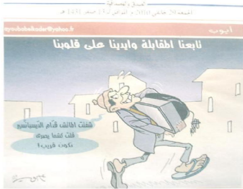
الصورة رقم (30) الصادرة بتاريخ 29 جانفي 2010.

جاءت الصورة تحت عنوان: (تابعنا المقاتلة وأيدنا على قلوبنا) أي مباراة الجزائر ومصر في الدور نصف النهائي لكأس أمم إفريقيا، التي أثارت مخاوف الكثيرين من إمكانية تكرار سيناريو السودان بما حمله من معطيات، ففي الصورة يظهر شخص يعيش وضعية اجتماعية مزرية، بدليل ما تعكسه هيئته ممثلة في ملايسه الرثة، وبيده جهاز تلفزيون يبدو أنه حمله معه لمشاهدة اللقاء، كما يتضح من خلال الرسم قوله: (شفت الماتش قدام الديسانسيع قلت كشما يصري نكون قريب)، ليكون الموضوع هنا قد تزامن وانحزام الجزائر أمام مصر بنتيجة أربعة أهداف مقابل صفر بتاريخ 28 جانفي 2010.