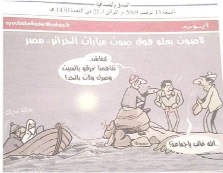
الصورة رقم (09) الصادرة بتاريخ 13 نوفمبر 2009.

1- كرة القدم كمعطى سوسيلوجي لاستظهار الوطنية: