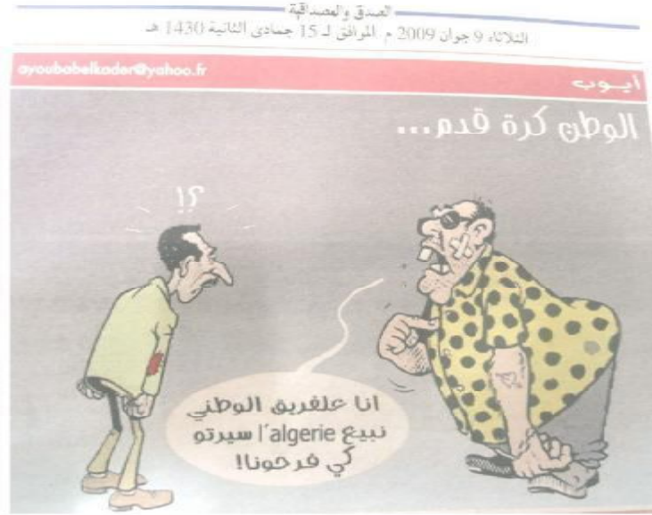
الصورة رقم (01) الصادرة بتاريخ 09 جوان 2009.

ترتبط هذه الصورة ارتباطا وثيقا بحدث كروي، شد إليه أنظار الكثير من المتابعين والمهتمين، من حيث أنه كان يدخل ضمن تصفيات كأس إفريقيا للأمم والعالم، فهذه الصورة جاءت عقب استضافة الفريق الجزائري لنظيره المصري بملعب "مصطفى شاكر" بالبلدية في مباراة الذهاب، التي أجزيت بتاريخ 07 جوان 2009 وانتهت بتفوق الجزائر 3-1، ما أثار حفيظة المنتخب المصري الذي لم يهضم الخسارة وبدأ في إطلاق سيل من الاتهامات نحو الطرف الجزائري تحت ذريعة حدوث تجاوزات وتعرض اللاعبين المصريين لتسمم غذائي عقب تناولهم لطبق الكسكسي في الجزائر، ليأخذ الحدث أبعادا وتطورات خطيرة، استفادت منه الصحافة كثيرا وجعلت منه مادة دسمة، تلاعبت بتفاصيله وحيثياته بالشكل الذي يخدمها، ليتأجج الصراع بين الطرفين، والمثير في ذلك التفاف الجماهير حول الحدث وترقيتها الدائم وعلى مدار أسابيع طويلة لجديد القضية وتطوراتها، كل هذه المعطيات ضرورية في الطرح لأنه ليس بالإمكان قراءة الصورة الموجودة بين أيدينا من دون التعرّيج على ما حدث بالضبط، فهذا الرسم جاء تكملة لما كان قد وقع بين الطرفين دون تفصيل فيه، ليكتفي صاحبه "أيوب" بالإشارة فقط إلى الحماس الكبير الموجود لدى الشعب (وما يمكن أن تفعله الكرة بمحبيها الذين قد يضحون بالكثير في سبيل الظفر بنتيجة إيجابية)، ليكون هذا هو موضوع الرسالة الموجودة بين أيدينا، إلا أن