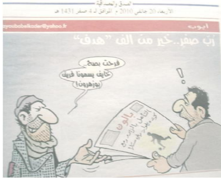
الصورة رقم (26) الصادرة بتاريخ 20 جانفي 2010.

ولهذه الصورة أيضا طابع اجتماعي وهو ما يركز حوله "أيوب" على الدوام قبل أن يتطرق في الحديث عن قضايا أخرى، يقينا منه بأهمية ذلك البعد كونه يتعلق بالفرد والمجتمع وعلاقاته، فكما هو معلوم فإن الكاريكاتور وجد أصلا لنقل اهتمامات الأفراد ومعاناتهم ومن ثم ترجمتها في شكل خطوط ساخرة، لكنها هادفة وذات رسالة عميقة.