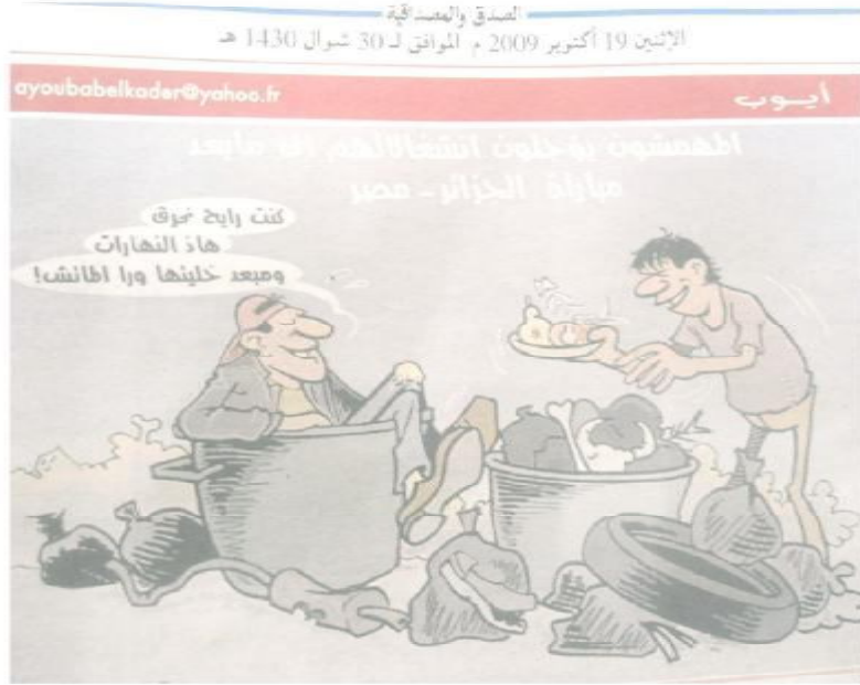
الصورة رقم (05) الصادرة بتاريخ 19 أكتوبر 2009.

ما يميز موضوعات "أيوب" عن سواه من الرسامين هو غلبة الطابع السوسولوجي عليها، لإدراكه وقناعته بأهمية هذا البعد ومدى نفاذه إلى الجماهير، فهو أساس حركية المجتمع وموجه يمكن قراءة باقي المستويات من سياسية، اقتصادية، ثقافية وحتى رياضية، فهو بهذا الشكل يمثل الكل وأساس الظواهر، لذلك نجد "أيوب" عند كل مرة يستحضره ويقحمه ضمن مواضيع أخرى حتى ولو كانت تبدو بعيدة عنه بعض الشيء، لكن بمجرد أن تمنع النظر في الصورة وتقرأ ما وراء خطوطها تستوعب سبب إقدام "أيوب" على ذلك، فخبرته مكنته من معرفة طرق الربط بين الظواهر، أسبابها وكذا خلفياتها وهذا هو المطلوب اليوم من رسامي الكاريكاتور حتى لا تأتي مواضيعهم جافة، ناقصة، فهي تحتاج إلى نبض المجتمع حتى تكتمل تفاصيلها، خاصة وأن هذا الفن يعرف اليوم في الجزائر نوعاً من الحركية والإقبال الجماهيري جرأته ودخوله غمار مواضيع كانت تعتبر في مرحلة سابقة من المحظورات.