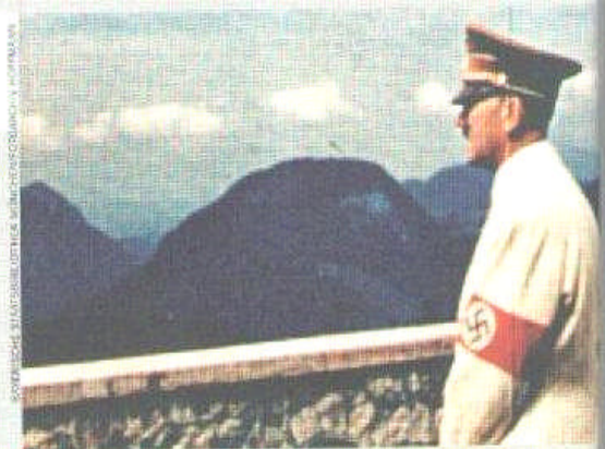
Adolf Hitler am Obersalzberg „Dann sollen Sie etwas erleben!“

Protokoll des Treffens Schuschnigg – Hitler am Berghof bei Berchtesgaden am 24. Februar 1938.*